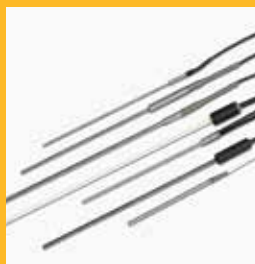
Sensores de temperatura calibrados

Hay disponible una gran variedad de accesorios para ayudarle a aumentar al máximo la productividad, pero los siguientes resultan esenciales para la mayoría de los usuarios.