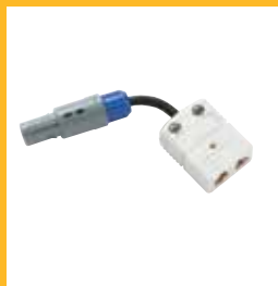
Adaptador universal para termopar