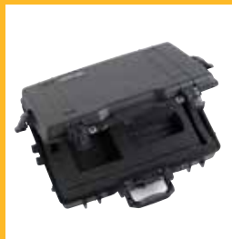
Maletín de transporte de sonda y lectura