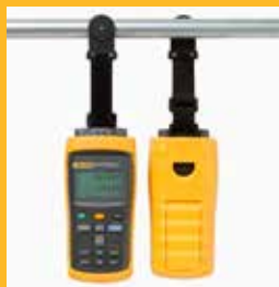
Juego de accesorios para colgar el multímetro TPAK